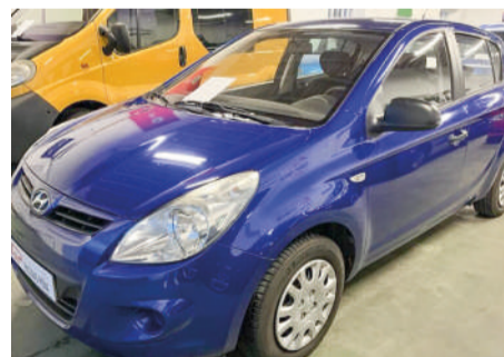
HYUNDAI I20 1.2 Classic | 80CV Año 2011 | 50.000 Km