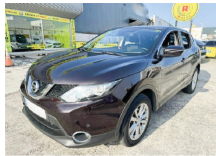
NISSAN QASHQAI 1.6DCI Acenta | 130CV Año 2015 | 142.000 Km