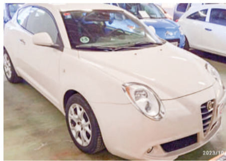
ALFA ROMEO MITO 1.3JTDM Distintive | 95CV Año 2012 | 154.000 Km