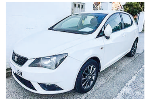
SEAT IBIZA 1.6 TDI 90cv Edition 5p | 90CV Año 2015 | 154.000 Km