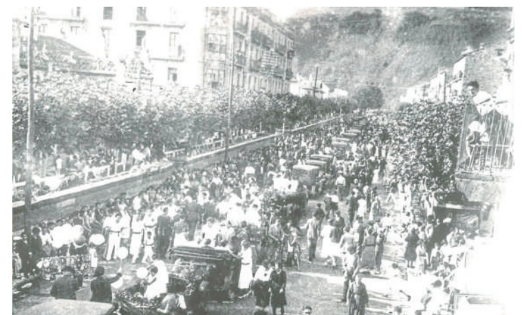
La Batalla de Flores en la calle del Túnel.

Debido a que el circuito volvió a quedarse estrecho y que sólo había gradas de pago, en 1978 la fiesta fue nuevamente trasladada, esta vez a la Alameda Miramar, donde se sigue celebrando en la actualidad y pasando a ser el desfile de un solo sentido.