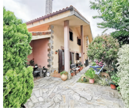
Casa en Carasa 220m 2 y 331m 2 de parcela

Casa unifamiliar de 2 plantas con 5 habitaciones y 3 baños .