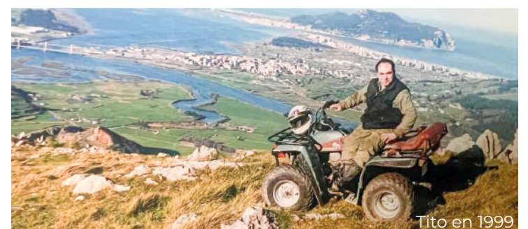
Tito en 1999