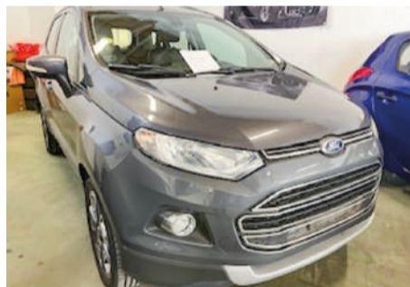
FORD ECO SPORT 1.5 TDCi 4x2 ASS Titanium 5p. | 95CV Año 2017 | 121.000 Km