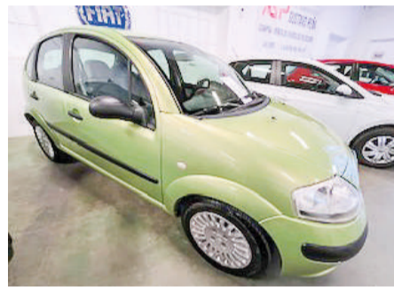
CITRÖEN C3 1.4 HDi Exclusive 5p. | 68CV Año 2004 | 169.000 Km