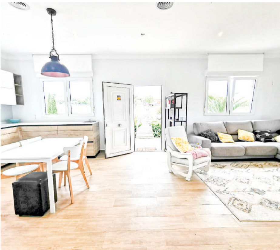
Chalet en Meruelo 108m 2 y 1.268m 2 de parcela

Chalet de 1 planta totalmente amueblado y equipado.