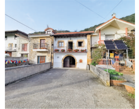
Casa adosada en Liendo 300m 2 y 350m 2 de parcela

Casa adosada de 4 habitaciones , dos de las cuales son tipo alcoba, y 1 baño en la tranquila localidad de Isequilla.