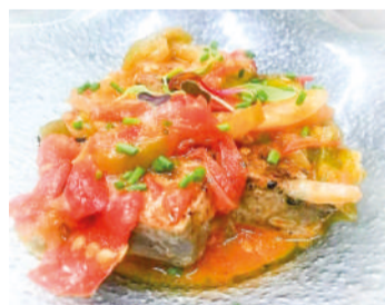
Bonito a la Colindresa (tomate y pimientos de la huerta de Colindres)