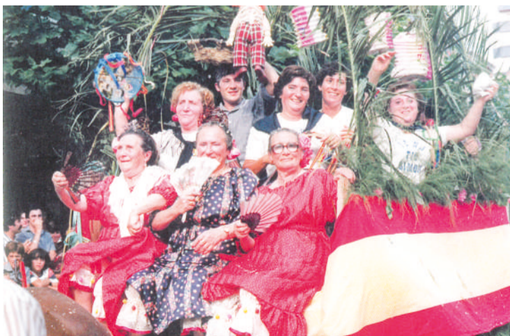
Carro de Las Pejinas. Años 80.