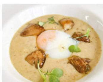
Huevo a baja temperatura parmentier de patata y bolletus.