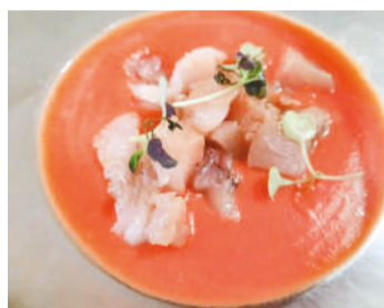
Tartar de bonito del norte sobre salmorejo .