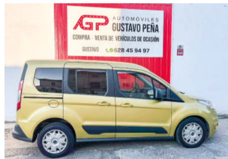
FORD TOURNEO CONET Ambiente 1.6TDCI | 95CV Año 2015 | 101.000 Km