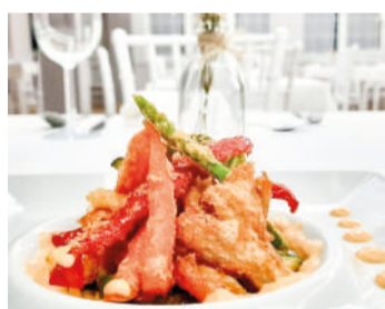
Tempura de las verduras de la huerta de Cantabria.