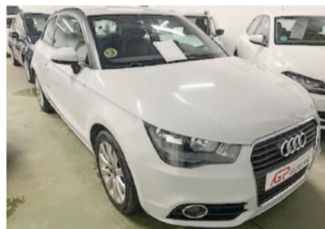
AUDI A1 1.6 TDI Atraction | 90CV Año 2013 | 137.000 Km