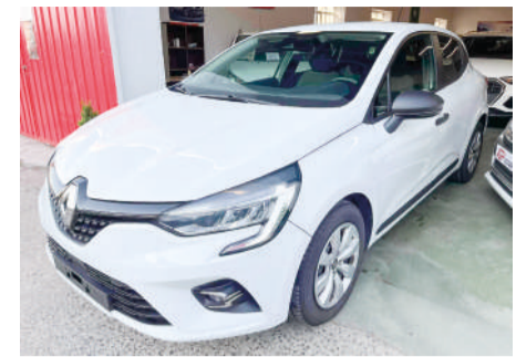
RENAULT CLIO 1.5DCI Emotion | 85CV Año 2020 | 99.000 Km