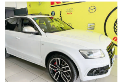
AUDI SQ5 SQ5 3.0TDI QUATTRO | 313CV Año 2015 | 180.000 Km