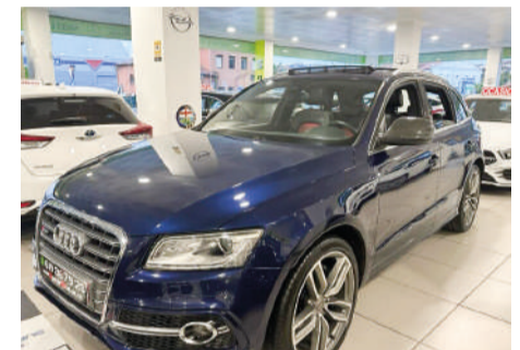
AUDI SQ5 3.0TDI Quattro Tiptronic | 313CV Año 2014 | 208.000 Km