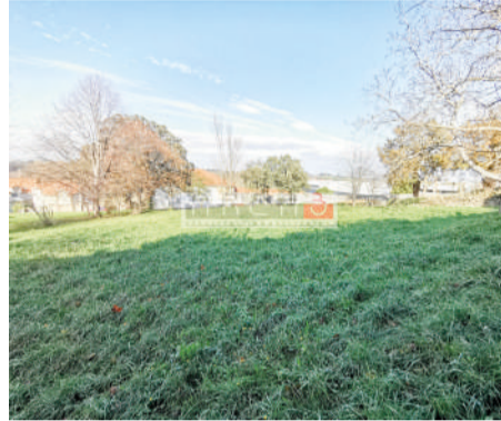
Terreno en Heras (Medio Cudeyo) 1.268 m 2

Una Oportunidad única y asequible Cerca de Santander .