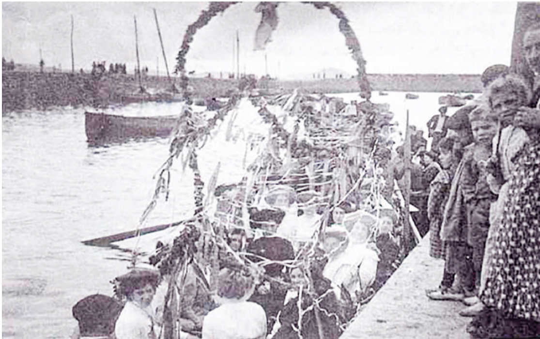
La Argentina. Ganadora de la primera edición de la Batalla de Flores en 1908.