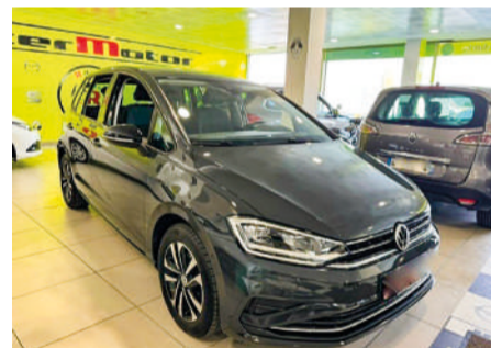
VOLKSWAGEN GOLF Sportsvan | 115CV Año 2019 | 84.000 Km