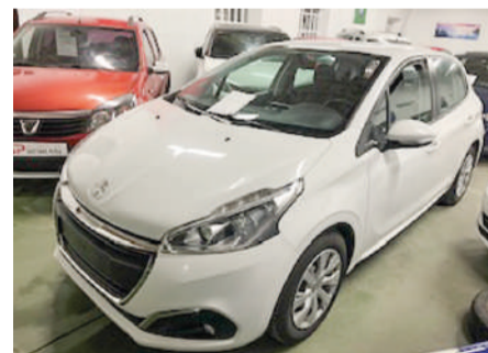
PEUGEOT 208 1.6 HDI | 75CV Año 2019 | 111.000 Km