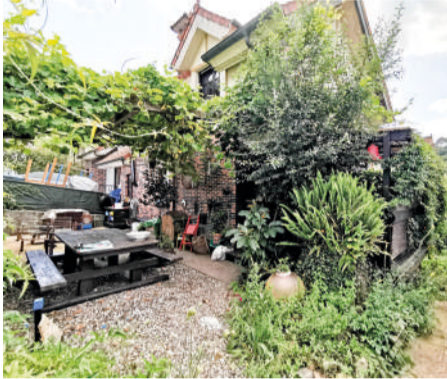
Chalet en Beranga 140m 2 y 200m 2 de parcela

Amplio chalet de dos plantas con 4 habitaciones espaciosas y luminosas y 2 baños . Habitación en planta baja ideal para convertir en despacho, cuarto de invitados o ampliar tu espacio vital.