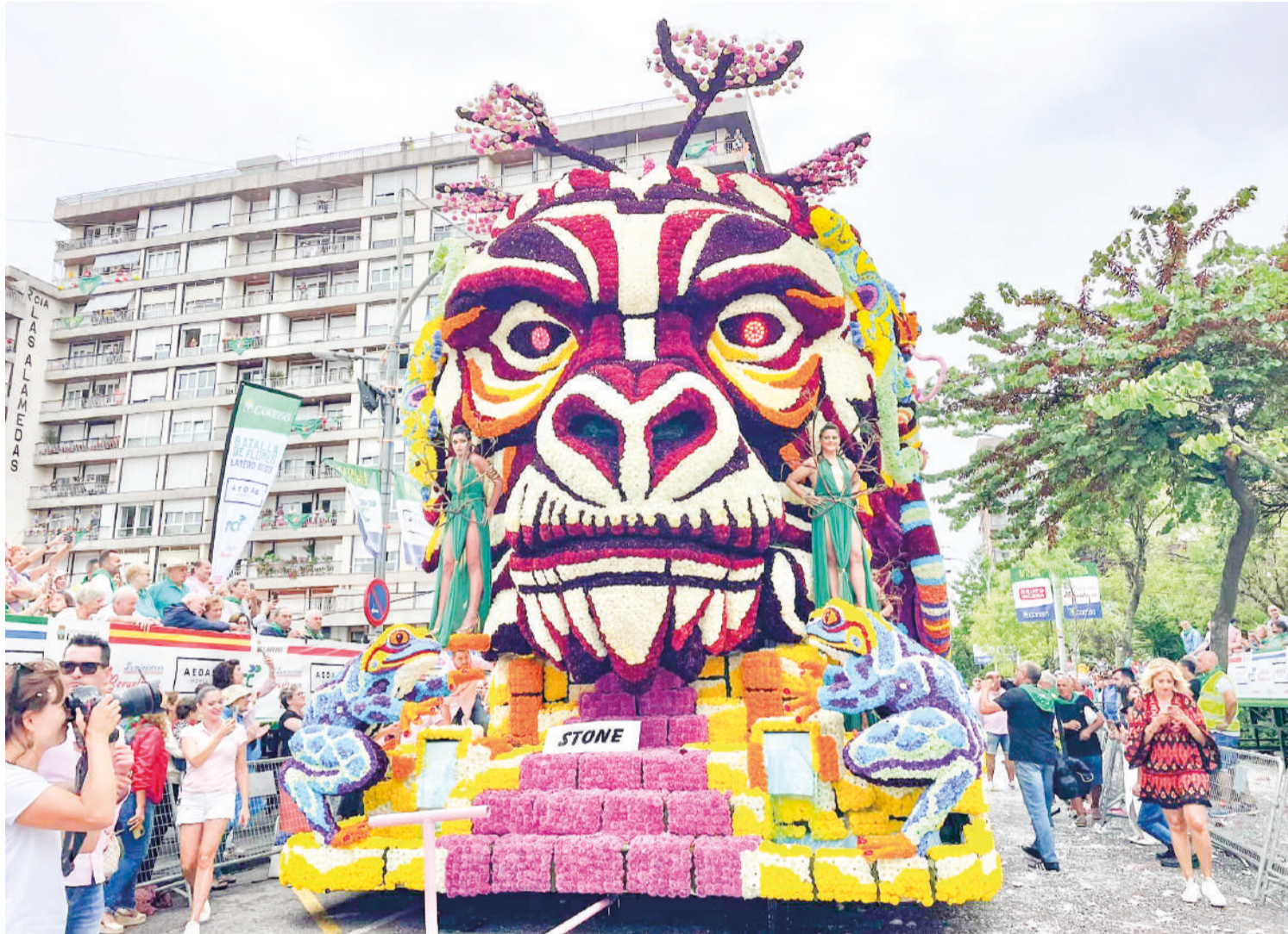
Stone, de la Asociación 'Mi vida loca', carroza ganadora de la Batalla de Flores 2023.

Conocemos la historia detrás de una de las fiestas más emblemáticas de Cantabria oriental.