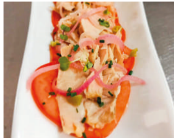
Ensalada de tomate y bonito del norte .

Por supuesto, y para terminar, no nos olvidamos de la patata, que durante todo el verano se recoge y es la protagonista de los platos más tradicionales de los municipios marineros, tal y como explicamos el mes pasado, como es la marmita o el marmite, que en este mes y el que viene, son los protagonistas de muchas fiestas en nuestros pueblos, como Colindres, Laredo, Argoños o Santoña.