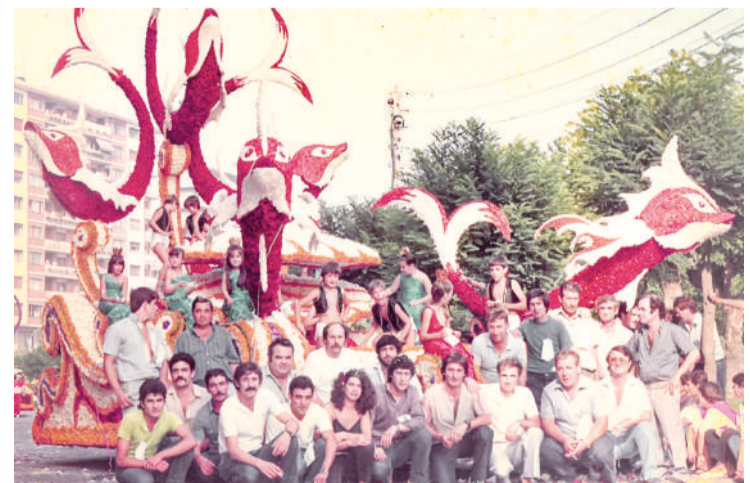
Fantasia Marina. Ganadora en 1984. Grupo Amigos.