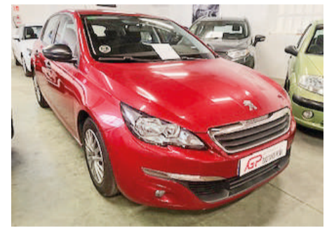
PEUGEOT 308 1.6HDI | 120CV Año 2015 | 171.000 Km