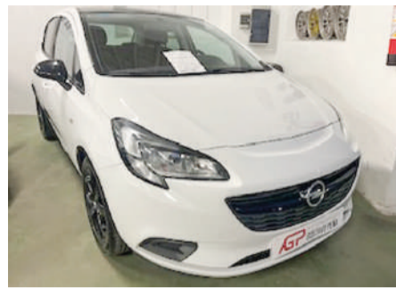
OPEL CORSA 1.4 turbo | 120CV Año 2018 | 88.000 Km

Recogemos su vehículo como parte del pago y le ofrecemos financiación a su medida.