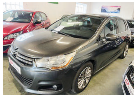
CITRÖEN C4 HDI TENDENCE | 92CV Año 2011 | 147.000 Km