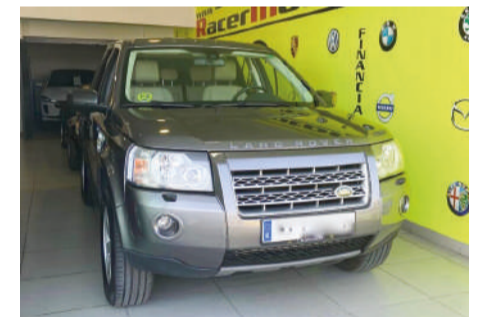
LAND-ROVER FREELANDER 2.2 TD4.E | 160CV Año 2010 | 152.000 Km