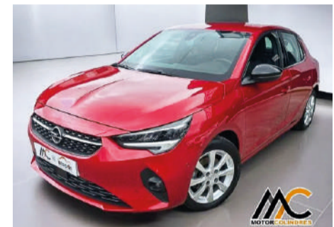
OPEL CORSA 1.2T XHL 100cv Elegance Año 2019 | 69.332 Km