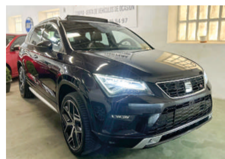
SEAT ATECA 1.6 TDI Style | 190CV Año 2018 | 118.000 Km