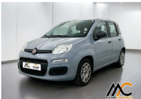
FIAT PANDA 1.0 Hybrid Gse 70cv Launch Edition Año 2022 | 15.150 Km Km