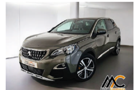
PEUGEOT 3008 1.5L BlueHDi 96kW (130CV) S&S Allure Año 2020 | 92.400 Km