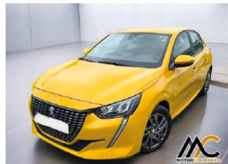
PEUGEOT 208 1.2 PureTech 100cv Active Pack Año 2021 | 66.026 Km