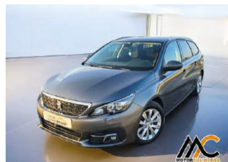
PEUGEOT 308 1.5 BlueHDi 130cv S&S Style Año 2019 | 84.629 Km