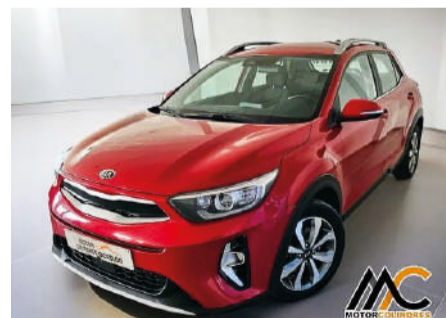
KIA STONIC 1.0 T-GDi MHEV iMT 100cv Drive Año 2021 | 72.301 Km