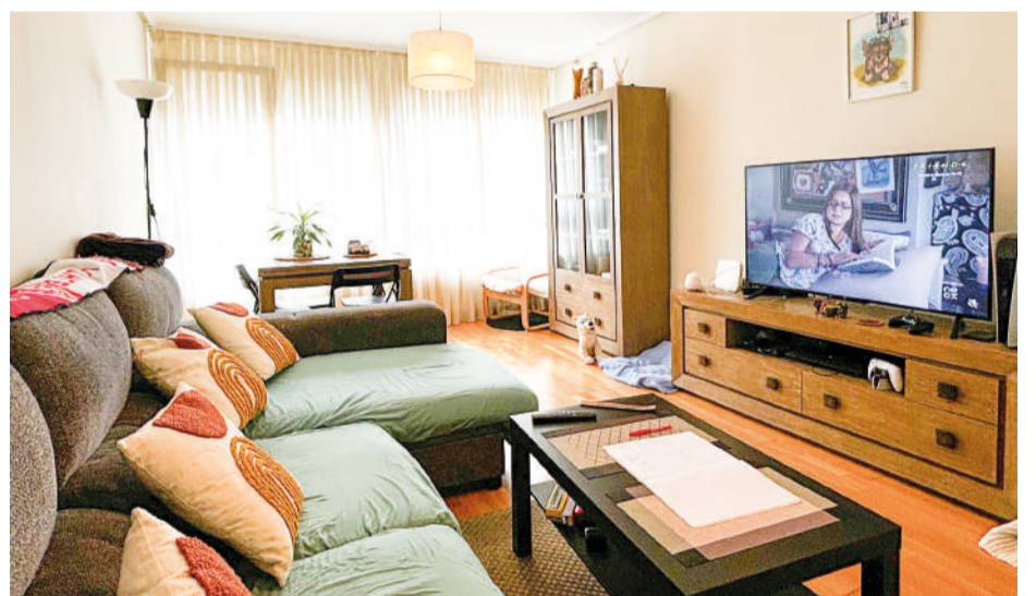
Piso en Treto 79 m 2

Piso luminoso de 2 habitaciones , una de ellas convertida en vestidor , y 2 baños , uno con plato de ducha y otro bañera en Treto, en el municipio de Bárcena de Cicero.