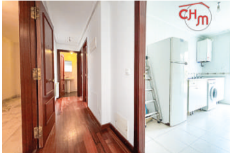
Piso en Gibaja 60 m 2

Piso amplio y luminoso en la tranquila localidad de Gibaja , perteneciente al municipio de Ramales.