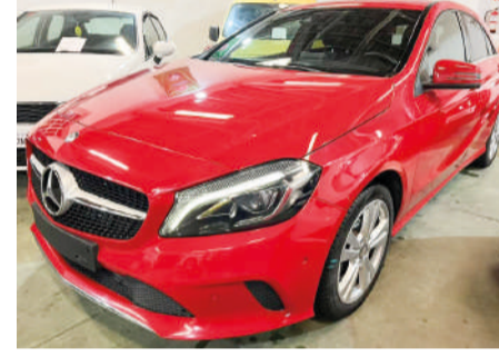
MERCEDES-BENZ CLASE A Clase A 180 CDI II | 110CV Año 2016 | 150.000 Km