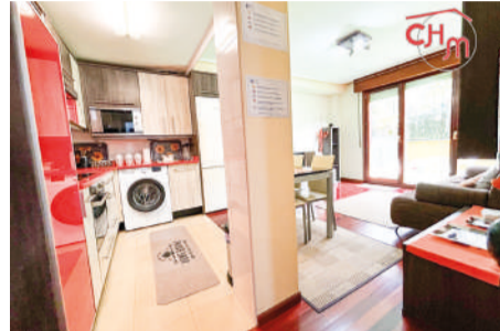
Piso en Ramales de la Victoria 46 m 2

Piso de 1 habitación, 1 baño y salón comedor luminoso con cocina americana en la localidad de Gibaja, en Ramales de la Victoria.