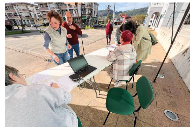
Vecinos presentando alegaciones en Solórzano.

una solución a la crisis climática y energética, esta no debe pasar por los intereses de los municipios y sus vecinos.