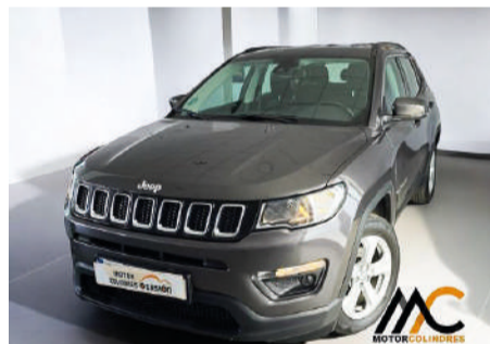
JEEP COMPASS 1.6 Multijet 120cv 4x2 Longitude Año 2020 | 32.310 Km