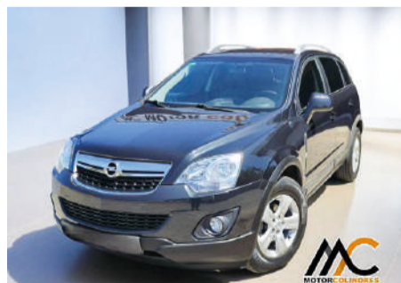
OPEL ANTARA 2.2CDTI1163CVStart&StopSelective4X2 Año 2014 | 170.950 Km