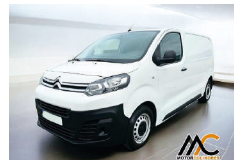
CITROËN JUMPY Confort Talla M BlueHDi (95CV) Año 2018 | 60.200 Km