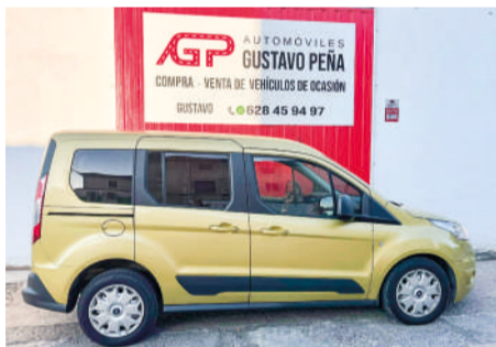
FORD TOURNEO CONET Ambiente 1.6TDCI | 95CV Año 2015 | 101.000 Km