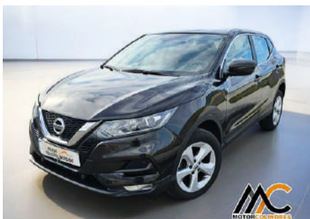
NISSAN QASHQAI 1.5 dCi 115cv E6D Acenta Año 2019 | 86.516 Km