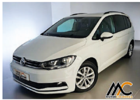
VOLKSWAGEN TOURAN 1.6 TDI 115cv Business & Navi Año 2018 | 73.730 Km