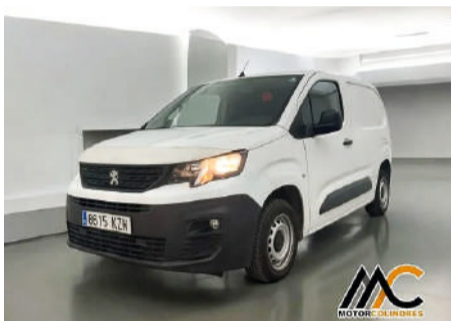
PEUGEOT PARTNER 1.6BlueHDi98cvProStandard600kg Año 2019 | 123.538 Km