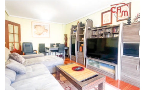
Piso en Bádames 78 m 2

Piso de construcción moderna, de 2 habitaciones, 2 baños, cocina amueblada y equipada con electrodomésticos de alta gama y salón .