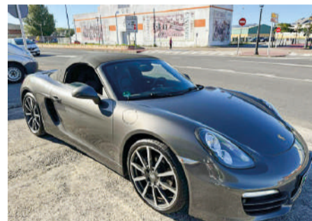
PORSCHE BOXSTER 2.7 2.7 Automático | 265CV Año 2014 | 126.000 Km