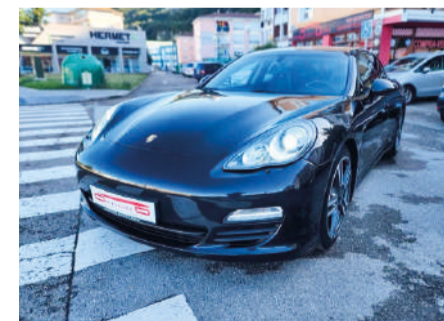
PORSCHE PANAMERA 3.0 TD Tiptronic 250CV Año 2012 | 170.000 Km