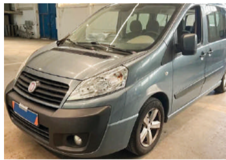
FIAT SCUDO 2.0JTDM Panorama Family Largo 130CV Año 2012 | 240.000 Km