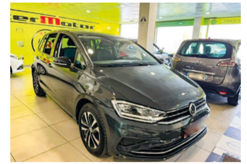
VOLKSWAGEN GOLF Sportsvan | 115CV Año 2019 | 84.000 Km