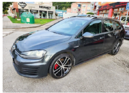
VOLKSWAGEN GOLF Variant GTD 2.0 TDI 184CV DSG BMTV Año 2016 | 160.000 Km