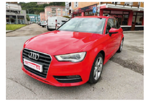
AUDI A3 Sportback 2.0 TDI 150cv Ambition Año 2014 | 160.000 Km