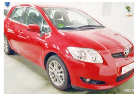
TOYOTA AURIS GL 1.3 5 puertas | 100CV Año 2010 | 149.000 Km