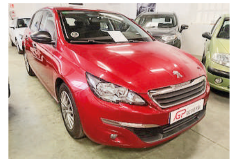
PEUGEOT 308 1.6HDI | 120CV Año 2015 | 171.000 Km