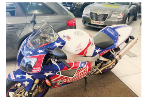
HONDA VTR SP2 | 1.000CV Año 2000 | 9.000 Km