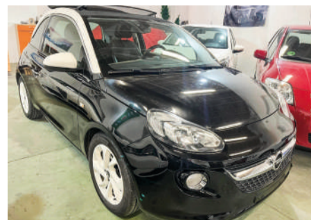
OPEL ADAM 1.2 DESCAPOTABLEI | 75CV Año 2019 | 122.000 Km