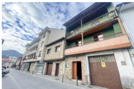
Casa adosada en Ampuero 350 m 2

Casa de cuatro alturas, con 3 habitaciones, 2 baños y amplio balcón .