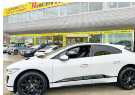
JAGUAR I-PACE EV400 SE Auto 4WD | 400CV Año 2018 | 156.000 Km