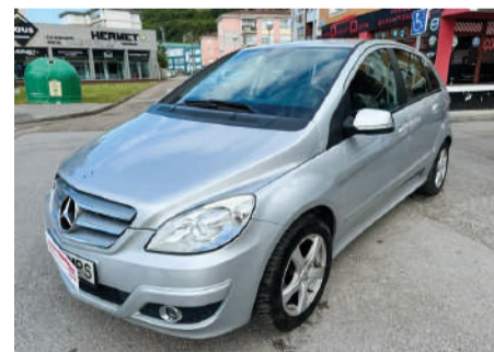
MERCEDES-BENZ CLASE B B 180 CDI BlueEFFICIENCY 109CV Año 2011 | 160.000 Km