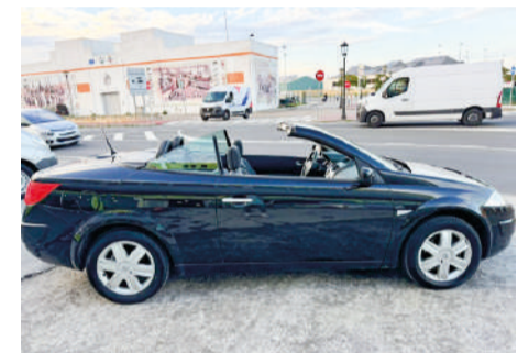
RENAULT MEGANE COUPECABRIO 1.9 DCI | 130CV Año 2005 | 195.000 Km