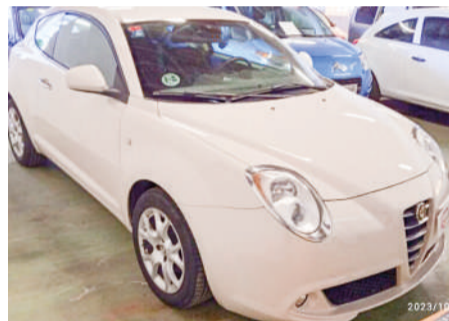
ALFA ROMEO MITO 1.3JTDM Distintive | 95CV Año 2012 | 154.000 Km