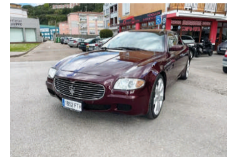
MASERATI QUATTROPORTE Sport GT DuoSelect 400CV Año 2007 | 70.000 Km