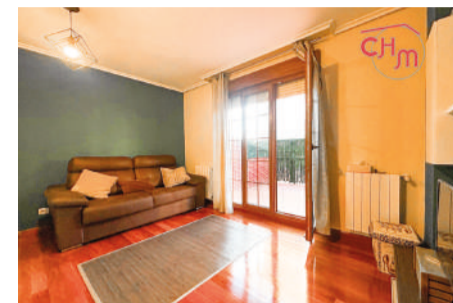
Piso en Bádames 57 m 2

Piso de construcción moderna, de 2 habitaciones, 1 baño con bañera, cocina amueblada y equipada y salón .