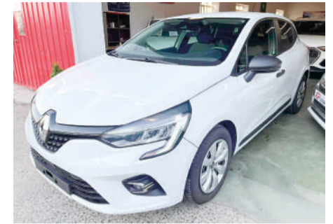
RENAULT CLIO 1.5DCI Emotion | 85CV Año 2020 | 99.000 Km