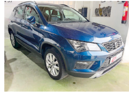
SEAT ATECA 1.6 TDI Style | 115CV Año 2018 | 101.000 Km