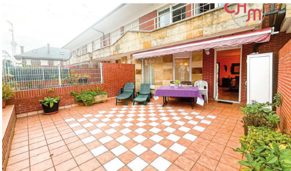
Chalet adosado en Laredo 200 m 2

Chalet adosado de 4 habitaciones y 3 baños en Laredo