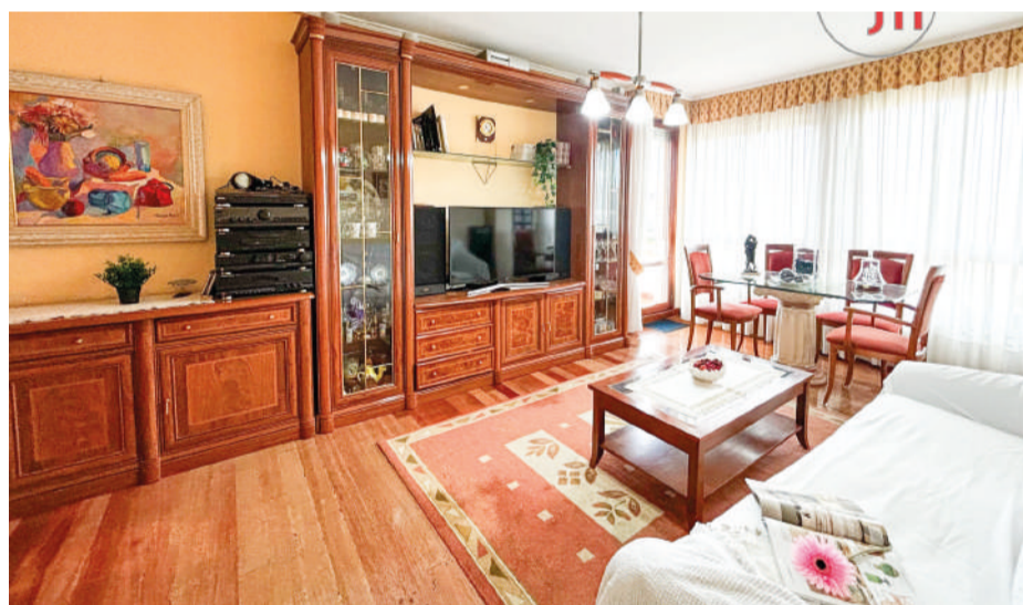
Piso en Colindres 80 m 2

Piso luminoso de 2 habitaciones, 1 baño , amplia cocina con salida a la terracea , un salón comedor con salida a otra terracea , ubicado en una tercera planta con ascensor.