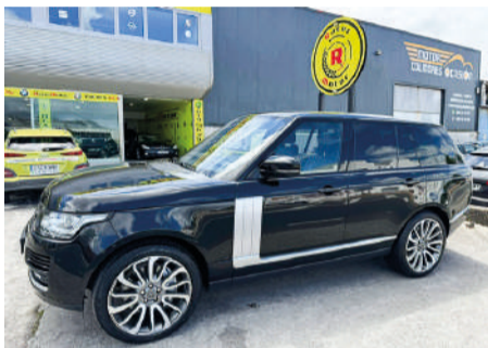
LAND ROVER VOGUE 4SDV8 | 340CV Año 2015 | 124.000 Km