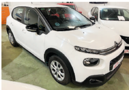
CITRÖEN C3 1.2 Gasolina | 81CV Año 2017 | 154.000 Km