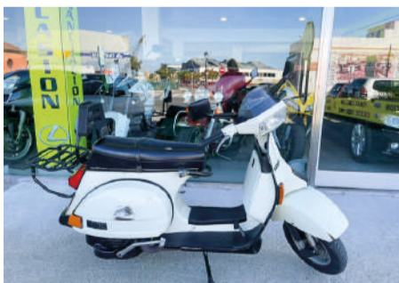
VESPA TX200 200CV Año 1991 | 18.000 Km