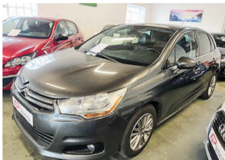
CITRÖEN C4 HDI TENDENCE | 92CV Año 2011 | 147.000 Km