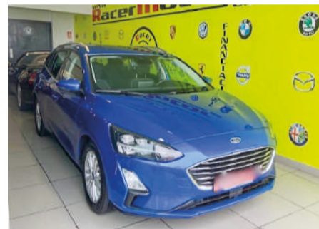
FORD FOCUS TURNIER 2.0 Ecoblue Titanium | 150CV Año 2019 | 175.000 Km