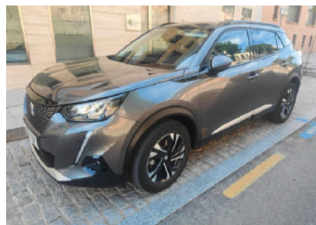
PEUGEOT 2008 Allure Pack BlueHDI 130 SS EAT8 Año 2021 | 80.000 Km