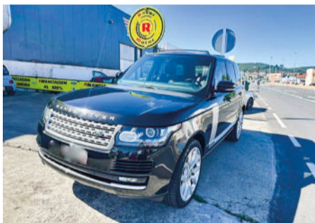
LAND ROVER RANGER ROVER Vogue 4.4SDV8 | 340CV Año 2015 | 135.999 Km