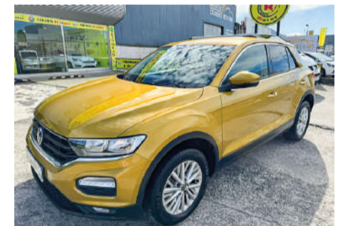
VOLKSWAGEN T-ROC 2.0TDI Edition | 115CV Año 2021 | 110.000 Km