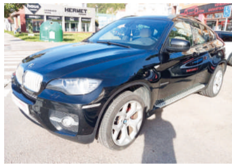
BMW X6 xDrive40d 306CV Año 2011 | 170.000 Km