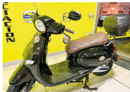
WAYSCRAL E-EQUIP 50CV Año 2021 | 500 Km