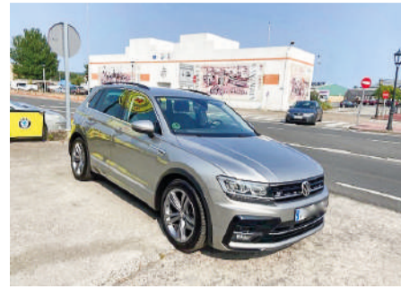
VOLKSWAGEN TIGUAN Advance 2.0TDI R Line | 150CV Año 2020 | 194.000 Km