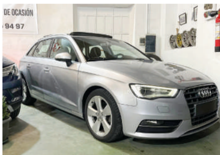
AUDI A3 A3 TDI Ambition | 150CV Año 2015 | 147.000 Km