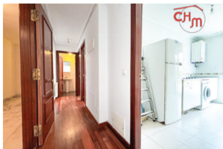
Piso en Gibaja 60 m 2

Piso amplio y luminoso en la tranquila localidad de Gibaja , perteneciente al municipio de Ramales.