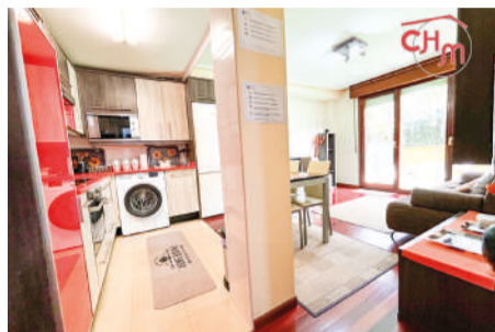
Piso en Ramales de la Victoria 46 m 2

Piso de 1 habitación, 1 baño y salón comedor luminoso con cocina americana en la localidad de Gibaja, en Ramales de la Victoria.