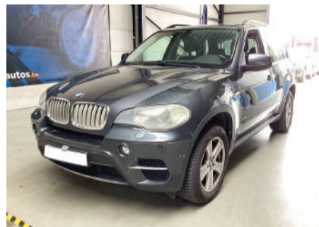
BMW X5 xDrive 30d 245CV Año 2011 | 221.000 Km