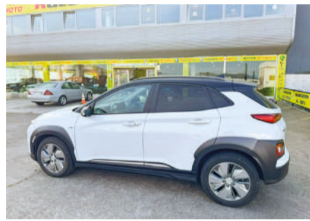
HYUNDAI KONA EV Style 2C | 204CV Año 2020 | 44.000 Km