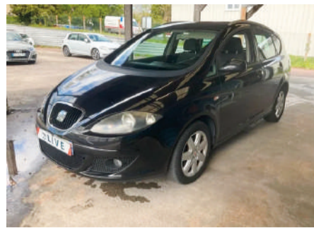
SEAT ALTEA XL 1.9 TDI 105cv Style Año 2008 | 199.000 Km