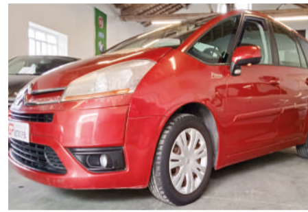
CITRÖEN C4 GRAN PICASSO 1.8 SXI 7 plazas | 125CV Año 2007 | 118.000 Km

Recogemos su vehículo como parte del pago y le ofrecemos financiación a su medida.