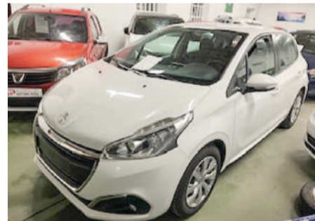
PEUGEOT 208 1.6 HDI | 75CV Año 2019 | 111.000 Km