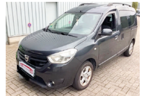
DACIA DOKKER Ambiance dCi 90CV Año 2013 | 170.000 Km