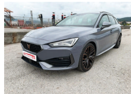
CUPRA LEON ST VZ 2.0 TSI 221kW 300 CV DSG Año 2023 | 7.000 Km