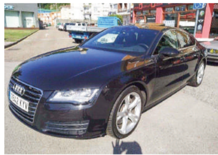
AUDI A7 Sportback 3.0 TDI 245CV Año 2012 | 165.000 Km