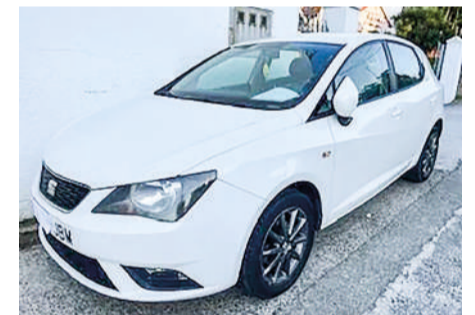
SEAT IBIZA 1.6 TDI 90cv Edition 5p | 90CV Año 2015 | 154.000 Km