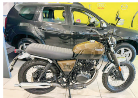
BRIXTON CROMWELL 125 ABS Cromwell 125CC | 125CV Año 2023 | 45 Km