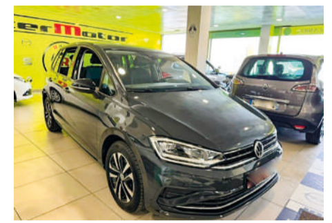
VOLKSWAGEN GOLF Sportsvan | 115CV Año 2019 | 84.000 Km