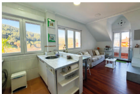
Apartamento en Gibaja 48 m 2

Apartamento de diseño moderno y práctico, de 1 habitación, 1 baño y cocina americana en la localidad de Gibaja, Ramales de la Victoria .