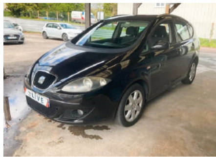
SEAT ALTEA XL 1.9 TDI 105cv Style Año 2008 | 199.000 Km