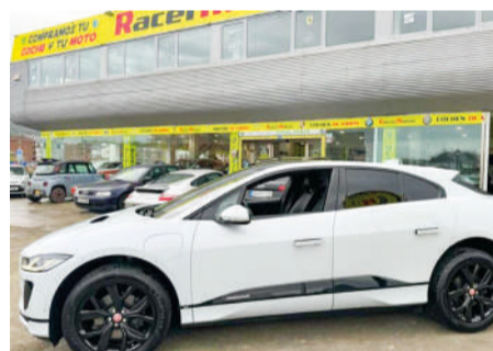
JAGUAR I-PACE EV400 SE Auto 4WD | 400CV Año 2018 | 156.000 Km