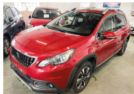
PEUGEOT 2008 1.6 HDI | 120CV Año 2017 | 140.000 Km