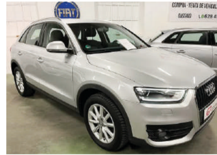
AUDI Q3 TDI 2.0 Diesel | 140CV Año 2012 | 144.000 Km