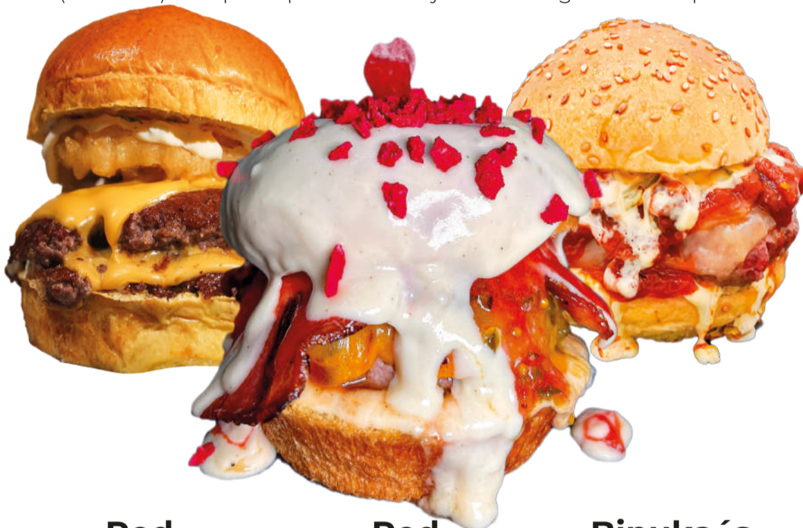
Red Neck The Surfers Burger (Somo)

Red Neck, de The Surfers Burger (Somo), Red Velvet, de Plaza Blanca (Ampuero) y Binuka's Champion, de Binuka's Burger (Galizano) compiten por ser la mejor hamburguesa de España.