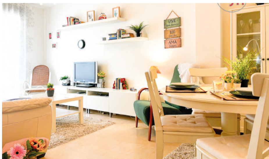
Piso en Limpas 42 m 2

Piso coqueto y luminoso de 1 habitación, y 1 baño, cocina y salón comedor además de balcones , situado en el tranquilo municipio de Limpas.